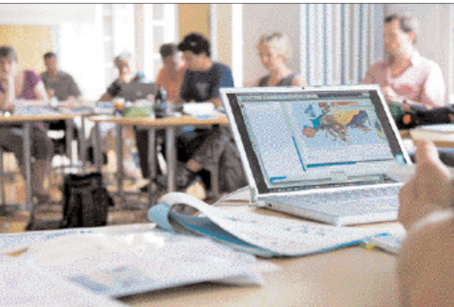
Cours dispensé aux spécialistes de la nature et de l'environnement, sanu, Bienne.

Ces formations ont lieu au siège de sanu à Bienne, d'autres sur le terrain, de Fribourg à Lausanne en passant par Vevey.