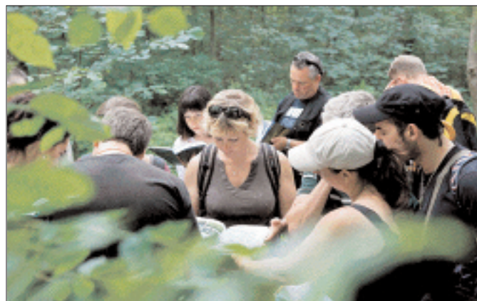
Excursion à la découverte des milieux naturels, Erelwäldli, Nidau.