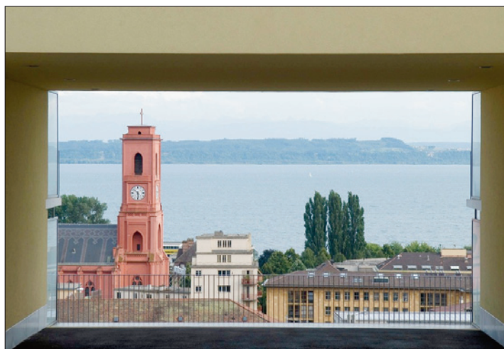
ÉGLISES Un rôle d'utilité publique à redéfinir? (DAVID MARCHON)

Reconnues d'utilité publique, comme de nombreuses associations, songez à Pro Infirmis, Pro Juventute, etc., ainsi qu'à des associations sportives et