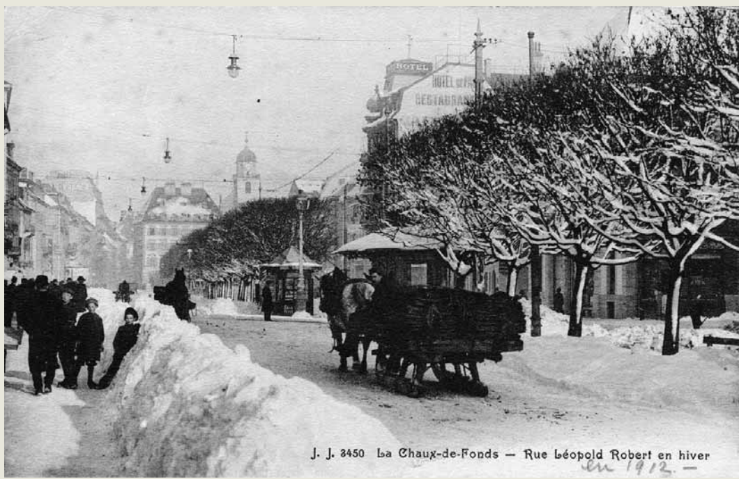
J. J. 2450 La Chaux-de-Fonds - Rue Léopold Robert en hiver