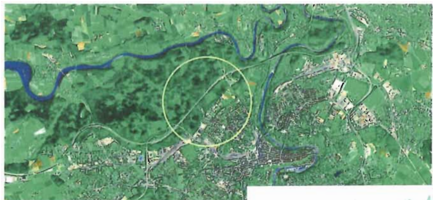
02 Vorschlag zur Stadterweiterung von Bern durch die W.

Nicole Wirz, Redaktorin Collage, wirz.n@gmx.ch