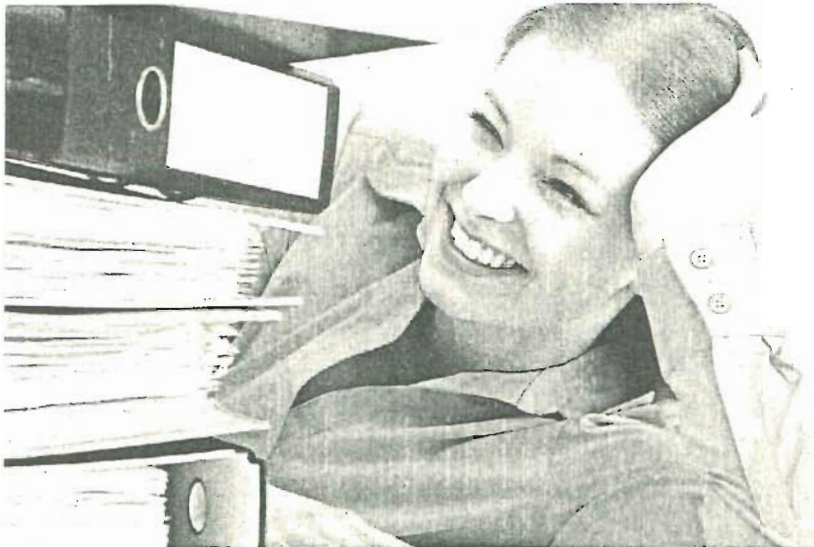
Ein Lächeln kostet nichts, bringt aber in jeder Situation viele Pluspunkte.