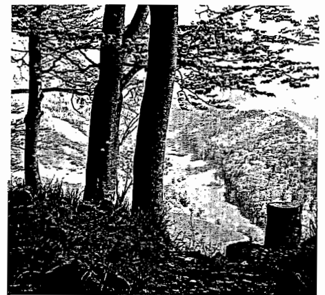
02 Regionaler Naturpark Thal, Kanton Solothurn

(pd/si) Im Seminar des Netzwerks Fortbildung Wald und Landschaft werden ausgewählte Instrumente und Modelle zur Analyse des Waldes präsentiert und hinsichtlich ihrer Einsatzmöglichkeiten verglichen. Dabei stehen folgende Fragen im Zentrum: Mit welchen Zielen und anhand welcher Kriterien wird der Wald untersucht? Durch wen geschieht ihre Bewertung? Welche Aussagekraft haben die Ergebnisse? Worin unterscheiden sich die vorgestellten Instrumente und welche Weiterentwicklungen sind zu erwarten? Die ganztägige Veranstaltung findet am 7. Oktober 2010 an der Hochschule für Technik in Rapperswil statt. Eine Anmeldung ist bis zum 20. September 2010 erforderlich.