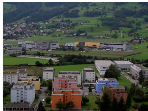
Der Mensch durch sein Planen, Bauen und Gestalten