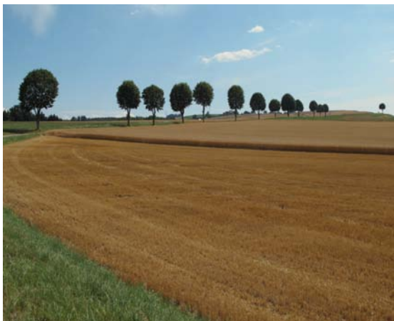
Der Mensch durch sein Nutzen