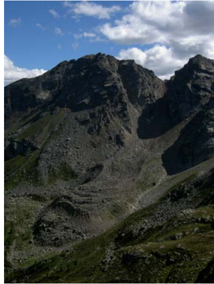
Die Natur mit ihren Kräften