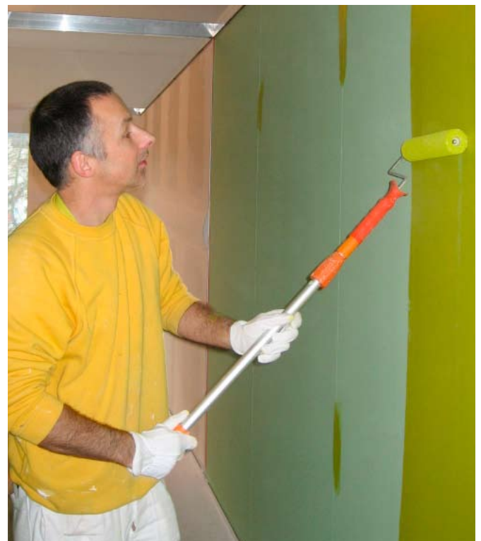
Schweizerischer Maler- und Gipserunternehmer-Verband SMGV