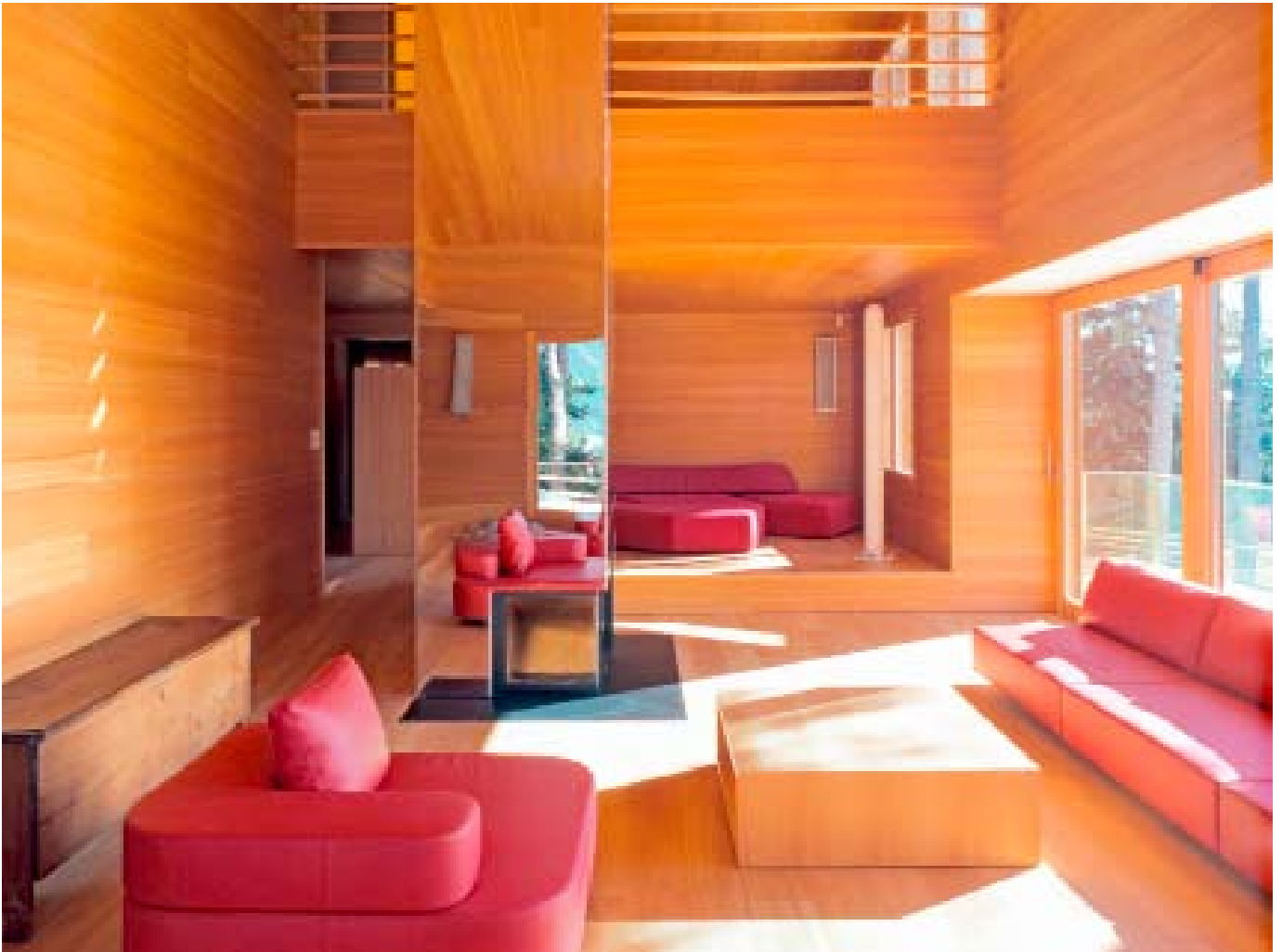
Hannes Henz, Zürich / LIGNUM

Der Reizstoff Formaldehyd ist in der Innenraumluft unerwünscht. Entsprechend sollten für eine gute Raumluftqualität die Formaldehydwerte möglichst tief liegen. Dieses Ziel kann durch diverse Massnahmen beim Bauen, Renovieren, Wohnen und Arbeiten erreicht werden. Kommt es zu Beschwerden mit Verdacht auf zu hohe Formaldehydbelastungen, sollte eine Raumluftmessung Klarheit schaffen. Formaldehydkonzentrationen über dem BAG-Richtwert für Innenräume gilt es mit Sanierungsmassnahmen zu senken.