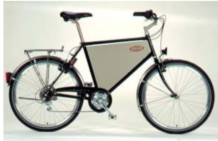
Flyer Classic 1995