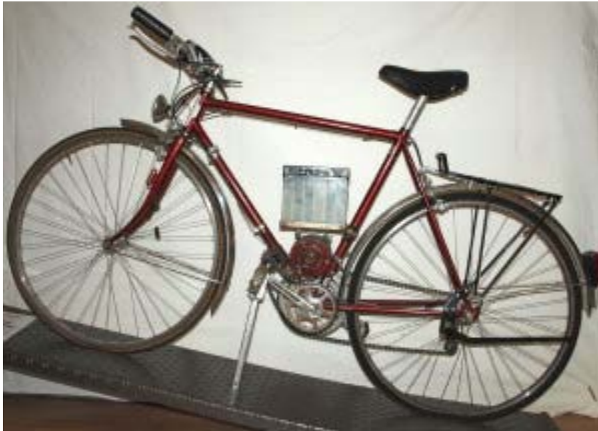
„Roter Büffel“ 1993